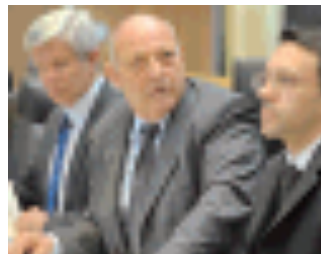
Berger, Durnwalder e Tommasini

BOLZANO. Sono spese dal fondo riservato. Ne hanno diritto i componenti della giunta provinciale. Rimaste, finora, sempre segrete. Nel 2010 Durnwalder ha prelevato dal «bancomat» pubblico 72 mila euro. Gli otto assessori si sono accontentati, tutti, insieme, di 55 mila euro. Nessun dovere di rendicontazione. Cosa diversa dalle spese di rappresentanza che pur cospicue - 125 mila euro annuali per il governatore, 60 mila a testa per gli assessori - sottostanno a regolare documentazione giustificativa. Un fondo così riservato che non lo trovi neppure nel bilancio di previsione 2011.